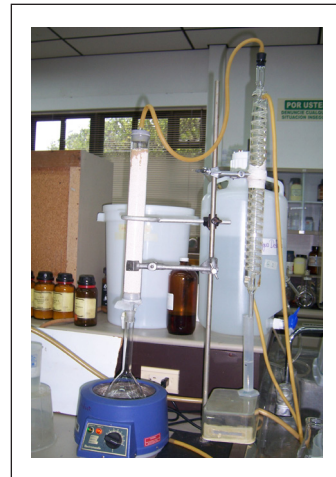
Figura 3. Deshidratación del alcohol.

Determinación del contenido de etanol. Para la determinación del contenido de etanol en las muestras rectificadas y deshidratadas se utilizó el método del hidrómetro (Figura 4) y se comparó con el método del picnómetro (Método 942.06 de la AOAC) (1). Con los valores de densidad y las Tablas donde se relaciona la densidad de soluciones de etanol saturado de aire y agua según la temperatura (8), basadas en Spieweck y Bettin (24), se determinó el contenido de etanol en porcentaje v/v y luego en porcentaje p/p de