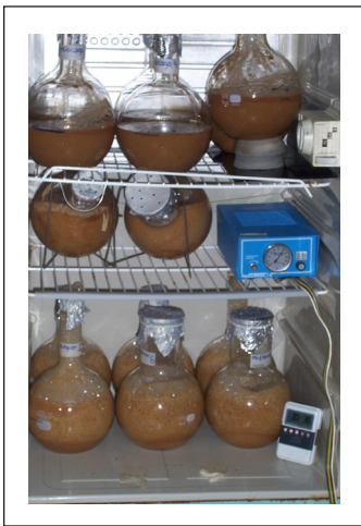
Figura 1. Fermentación alcohólica del mucílago.

Con el volumen del destilado y los grados alcohólicos se determinó la cantidad de alcohol obtenido en el proceso de fermentación, por cada litro de la solución agua-mucílago.