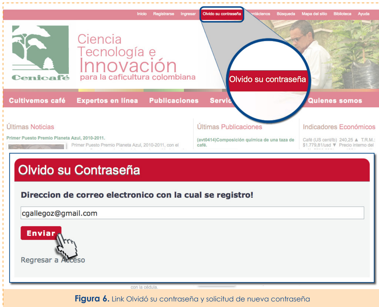
Figura 6. Link Olvidó su contraseña y solicitud de nueva contraseña

En minutos, recibirá en su correo electrónico un mensaje de notificación, en el que se le pide que vaya a una determinada página, y dé clic sobre el vínculo que se le indica.