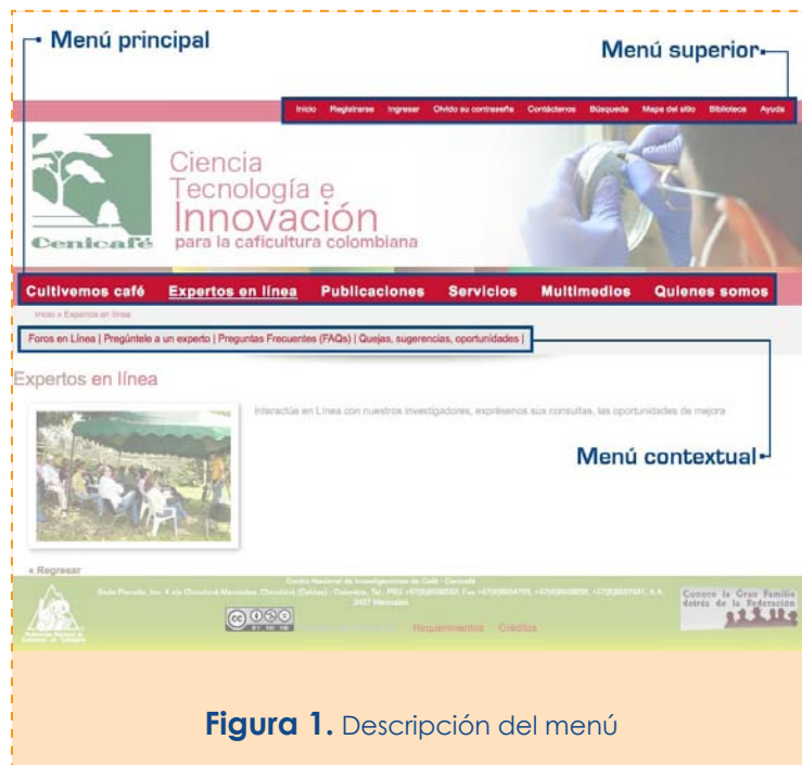
Figura 1. Descripción del menú