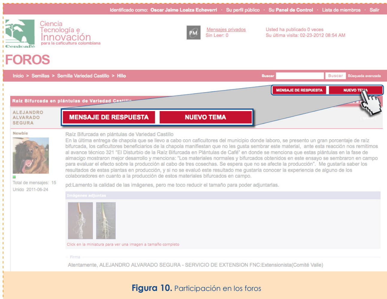
Figura 10. Participación en los foros

Después de elegir el foro de su preferencia y dentro del tema en el que quiere participar, oprima el botón "Mensaje de Respuesta o Nuevo tema" para diligenciar un formulario en el cual puede digitar el mensaje que desea compartir con extensionistas, cafeteros e investigadores (Figura 10).