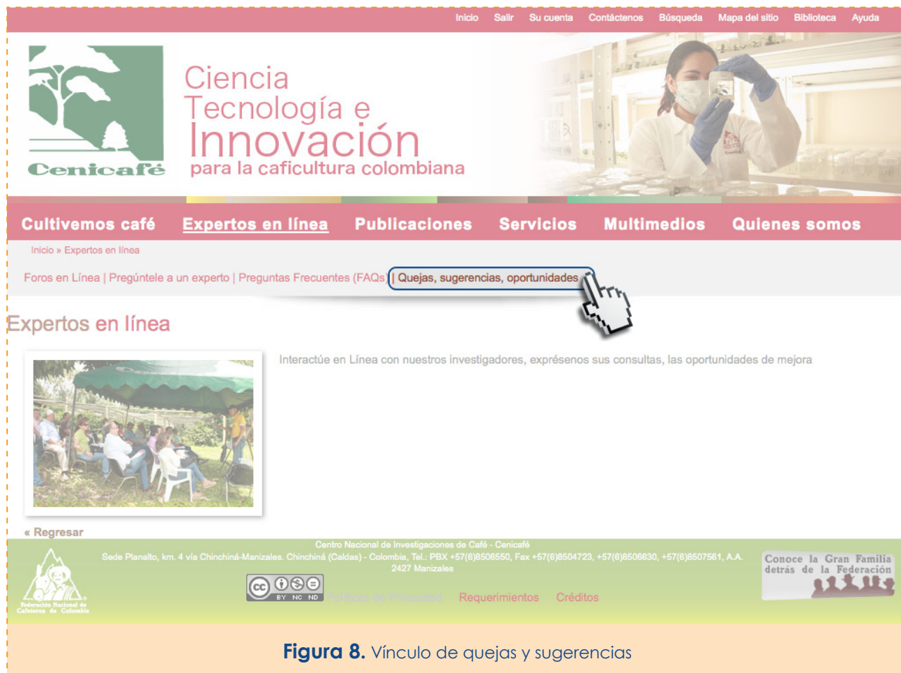
Figura 8. Vínculo de quejas y sugerencias