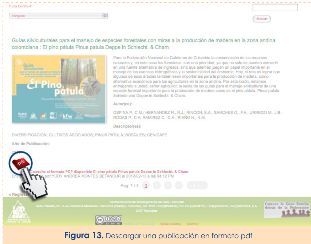
Figura 13. Descargar una publicación en formato pdf