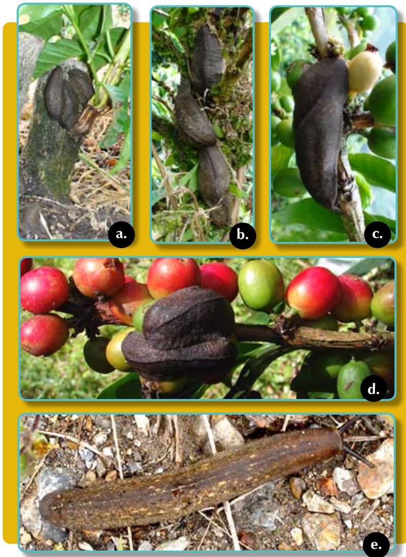
Figura 3. Hábitos de C. pulcher en el cultivo de café. a. Refugio de adultos en la base de zocas. b. En tallos de café. c - d. En ramas productivas consumiendo frutos. e. En el suelo y debajo de la hojarasca en el plato de los árboles.

el campo se contabilizaron en promedio diez babosas por árbol a plena luz del día, movilizándose sobre las ramas en días nublados y lluviosos, y la mayor actividad de este molusco se registró en las noches. Observaciones adicionales permitieron estimar un promedio de 15 frutos caídos por árbol a causa del daño ocasionado por C. pulcher durante la cosecha principal de 2008 (Figura 5f). Esto representaría pérdidas económicas importantes, entre 76 kg/ha/año de c.p.s. como pérdidas del caficultor.