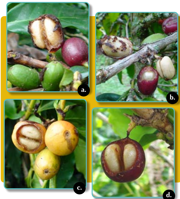
Figura 1. Daños en frutos de café ocasionados por la babosa Colosius pulcher . a-c. Consumo parcial y total de pericarpio y mucílago de los frutos de café con granos totalmente expuestos. d. Daño en el pedúnculo que ocasiona la caída de los frutos y granos al suelo.

Las babosas dejan un rastro de baba sobre los árboles que atacan, el cual sirve de guía para hallarlas en sus refugios durante el día; habitualmente se resguardan en las bases de los troncos y en la hojarasca en el suelo (Figuras 3a a la d). En