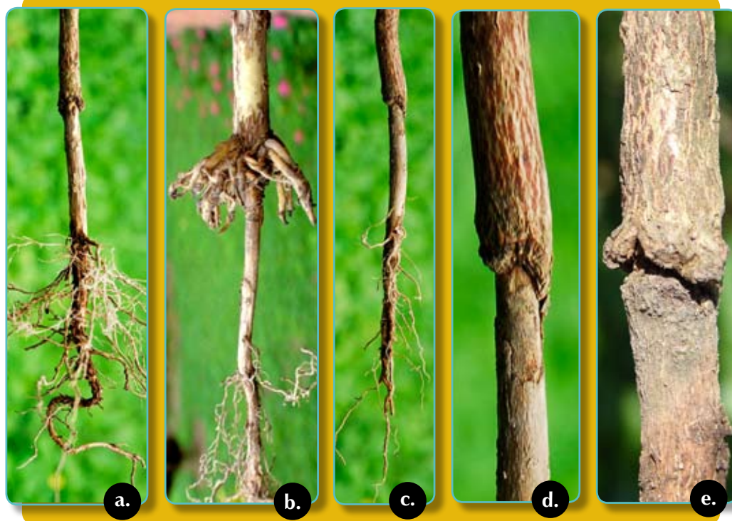
Figura 6. Anillado de tallos de café ocasionado por la babosa Sarasinula plebeia . a. Anillado total hasta 10 cm de altura del suelo en almácigos. b. Anillado total a 5 cm de altura a nivel del suelo; nótese la formación de raíces laterales por encima de la herida, como una medida de la planta para poder anclarse. c-d. Anillado total de tallos hasta 10 cm de altura del suelo en resiembras. e. Anillado y constreñimiento de tallos que ocasionan la interrupción del flujo de savia y marchitamiento de la planta.

obtener mejor anclaje; sin embargo, estas plantas quedan debilitadas y