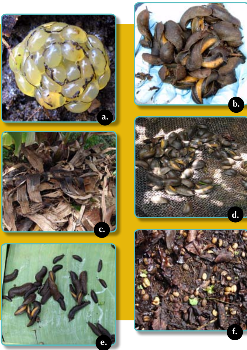
Figura 5. a. Masa de huevos de C. pulcher . b-e. captura de adultos de C. pulcher en cafetales con trampas construidas con costales de fique y hojas de plátano debajo de los árboles. f. Desgranamiento y caída de frutos de café al suelo ocasionado por la babosa C. pulcher .

En Colombia esta especie está distribuida en todas las zonas cálidas y templadas de la región Andina, en un rango altitudinal entre los 1.000 y 1.600 m (4, 24). La especie fue descrita originalmente en Nueva Caledonia, aunque también se encuentra en Australia, las islas del Pacífico, la isla de Madagascar, las islas de Comores y en América Central y América del Sur (10, 11, 22). Según Gomes (9), es una especie originaria de América del Sur.