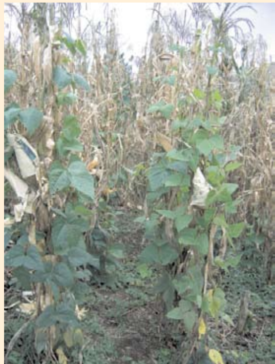
Figura 11.6. Zoca de café intercalado con frijol voluble.