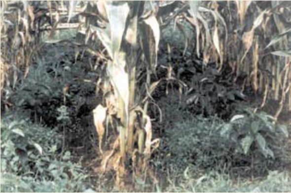
Figura 11.1. Siembra de café intercalda con maíz.

como en los renovados por medio del zoqueo; y de esta forma mejorar los ingresos, diversificar la producción y generar empleo rural.