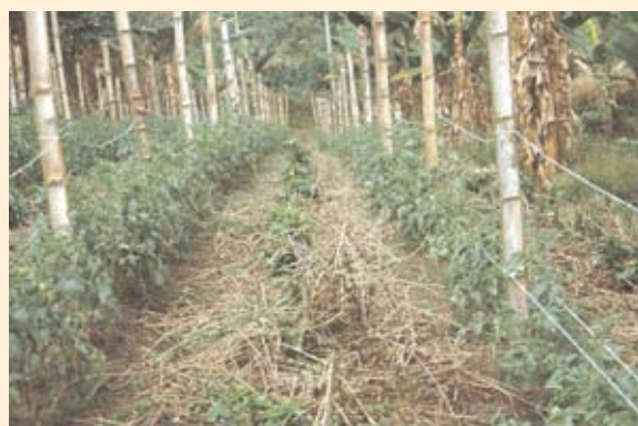
Figura 11.7. Cultivo de tomate intercalado con siembras nuevas de café.

La producción media de tomate de primera en la Subestación Experimental Líbano (Tolima) fue de 25 t/ha, en un lote renovado por zoqueo (Tabla 11.20), lo cual muestra la posibilidad de generar ingresos adicionales con una buena producción, sin afectar la producción de café (Tabla 11.21). Este sistema de producción se logra sembrando los surcos de tomate en el centro de la calle del café (surcos alternos) y sin aporcar las plantas de tomate, lo cual aparte de ser un gasto innecesario, predispone el lote a la erosión.