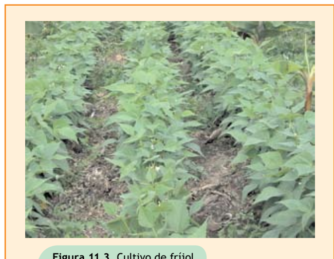
Figura 11.3. Cultivo de frijol.

Los experimentos se hicieron con siembras nuevas de líneas de café de Caturra x HT, con diferentes distancias de siembra del café y distintas poblaciones de frijol (diseño aditivo), con uno y dos ciclos seguidos de frijol para el caso de siembras nuevas de café y de dos y tres ciclos seguidos de frijol cuando las siembras se hicieron