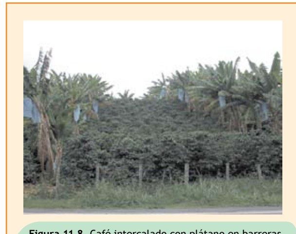
Figura 11.8. Café intercalado con plátano en barreras.

El plátano Dominico hartón, es el que más se cultiva en la zona cafetera, tiene en promedio cinco manos y alrededor de 8 a 12 dedos por mano y su producción