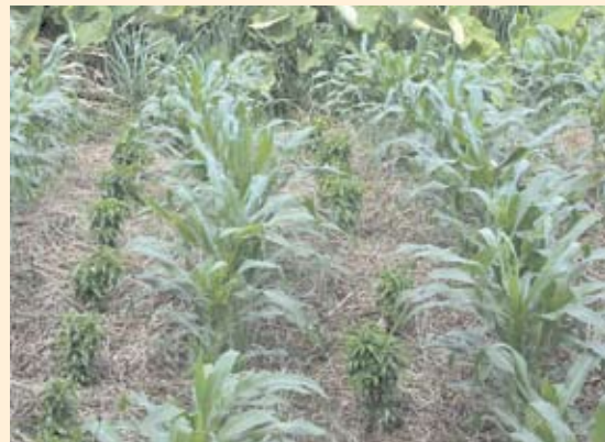
Figura 11.2. Zoca de café intercalada con maíz.

En los lotes con siembras nuevas de café, puede intercalarse hasta 45.000 plantas/ha de maíz en el primer ciclo, seguido con otro ciclo de 30.000 plantas/ha, sin que se afecte de forma significativa la producción de café de la primera cosecha ni de las subsiguientes.