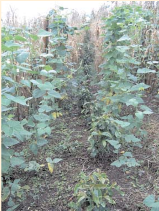
Figura 11.5. Zoca de café intercalado con frijol voluble.

De acuerdo con Granada (2006), la producción de frijol superó los 900 kg.ha -1 y los de los cultivares de maíz mejorados estuvieron por encima de las 4 ha -1 , con lo cual se contribuye a la generación de ingresos adicionales al café y a la seguridad alimentaria de la zona cafetera (Tablas 11.18 y 11.19).