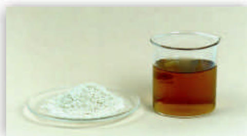
Figura 1. Producto atomizado en polvo y reconstituido en agua

(Figura 1) y se debe a las bajas temperaturas de secado empleadas (130-140°C) y principalmente, por el tamaño de partícula (diámetro 0,7mm). Si se trabaja en un atomizador a una escala mayor, es posible obtener una partícula más grande y por consiguiente, más coloreada.