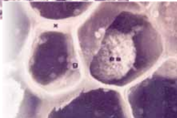
Figura 5. Corte transversal de tallo enfermo, presencia de esclerocios en el xilema

Observaciones en el tallo (corte transversal del xilema) (Figura 5) y en los frutos corte longitudinal del pericarpio) atacados por mal rosado, se realizaron al microscopio electrónico con la técnica de barrido encontrándose crecimiento micelial y esclerocios (11) (Figura 6).