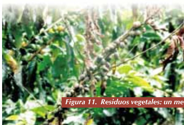
Figura 11. Residuos vegetales: un medio óptimo para la activación del hongo

cafetera, ubicadas a 1.300 y 1.600m de altitud, en los municipios de Manizales y Santa Rosa de Cabal, están relacionados con el comportamiento cíclico definido de la enfermedad, que se caracteriza porque la mayor formación de ramas coincide con los niveles más altos de precipitación y de mayor producción. Este autor sugiere que es necesario remover del 90 al 95% de ramas enfermas, para obtener una reducción importante cuando la incidencia es muy alta. Además, demostró que los costos de remoción, retiro del lote y quema de las ramas con mal rosado, se incrementan al doble y