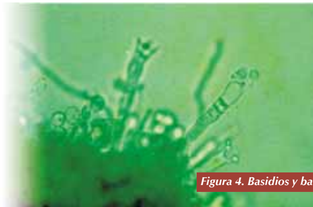
Figura 4. Basidios y basidiosporas

El conocimiento de este proceso infeccioso permite diseñar una estrategia de manejo de la enfermedad basada en los signos de la enfermedad, de tal manera que las aspersiones de productos fungicidas se realicen en el momento previo a la colonización de los tejidos; es decir, cuando aún no se hayan formado esclerocios (14).