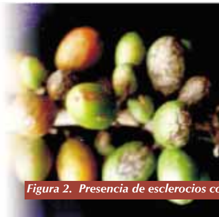
Figura 2. Presencia de esclerocios como motas de algodón