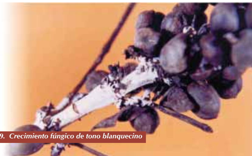
Figura 9. Crecimiento fúngico de tono blanquecino

Castaño y Bernal (5), hallaron que el tejido leñoso de las ramas se va secando desde su extremo superior hacia la base, debido a que el hongo