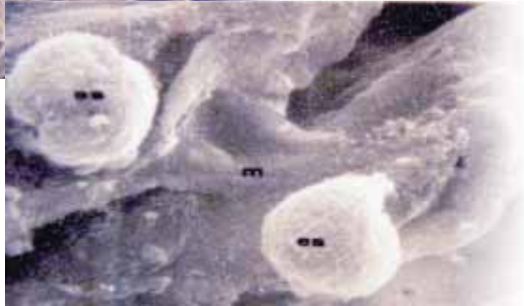
Figura 6. Crecimiento micelial y esclerocios en corte longitudinal de un fruto enfermo