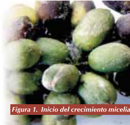
Figura 1. Inicio del crecimiento micelial formando una especie de telaraña

El proceso de infección del hongo ocurre en tres estados: inicialmente el estado micelial (Figura 1), que se caracteriza por un tenue crecimiento micelial blanco que avanza formando una especie de telaraña (3). Seguidamente se observa el estado de pústula estéril con presencia de esclerocios (Figura 2), que son agregados miceliales en forma de motas de algodón que van