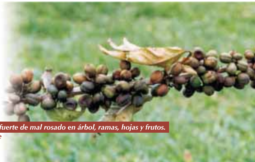
Figura 8. Ataque fuerte de mal rosado en árbol, ramas, hojas y frutos. Las estructuras, se observan secas como quemadas

Las manifestaciones más características de la enfermedad ocurren cuando los árboles afectados por mal rosado muestran marchitez y defoliación rápida acompañada del ennegrecimiento de los granos en formación, los cuales se cubren de un crecimiento fúngico de color rosado salmón. El tejido leñoso puede observarse con áreas necrosadas en forma de heridas alargadas y profundas, o bien, formando una especie de anillo alrededor de los tallos afectados (7). También se observa crecimiento fúngico de color rosado (Figura 9). Además, concluye que las zonas de fructificación (glomérulos) se afectan en su totalidad, el micelio cubre progresivamente los frutos hasta momificarlos completamente y ocurre la caída de los granos afectados que dará a los cafetos un aspecto de severo paloteo.