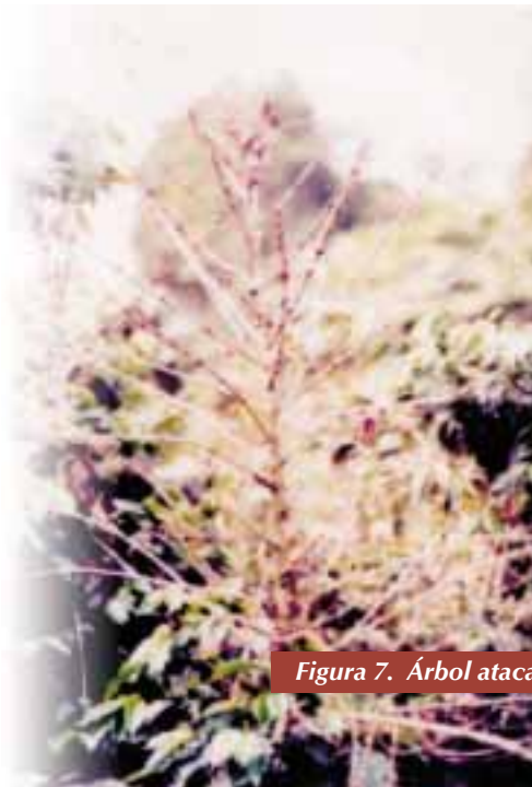
Figura 7. Árbol atacado por mal rosado con apariencia similar al paloteo por causa de otras enfermedades foliares

El efecto del hongo se debe a la destrucción de los tejidos conductores de agua y nutrientes en el tallo principal y en las ramas (15). Este mismo autor agrega que los cafetos enfermos se notan a distancia, porque las partes terminales de las ramas aparecen con el follaje amarillento y marchito. Cuando la enfermedad está en un