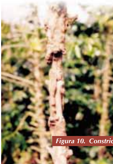
Figura 10. Constricciones irregulares en la corteza que aceleran la muerte de los tallos

Los resultados obtenidos por Ortíz (12), en dos fincas de la zona central