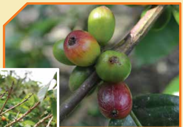
Broca del café