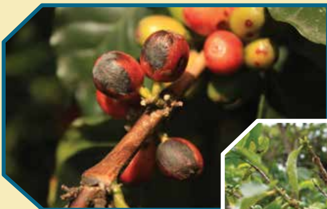
Mancha de hierro

En los frutos sobremaduros y secos que quedan en el árbol y en el suelo después de la cosecha se pueden albergar desde 10 hasta 150 adultos de broca y allí permanecen hasta que las condiciones ambientales le sean favorables para su reproducción (2). La emergencia de adultos de broca se incrementa después de períodos prolongados de déficit hídrico, sin embargo el mayor vuelo de adultos inicia con las primeras lluvias (5). En un estudio en un gradiente altitudinal de 1.200 a 1.700 m en la zona central cafetera, la emergencia de adultos de broca a partir de 20 frutos secos